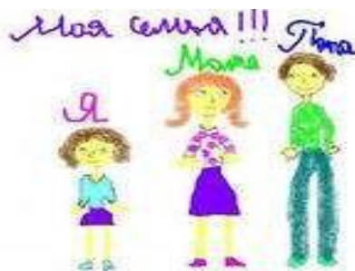
Фамилию и Имя

Вы взрослые - эталон поведения для ваших детей, не забывайте об этом!